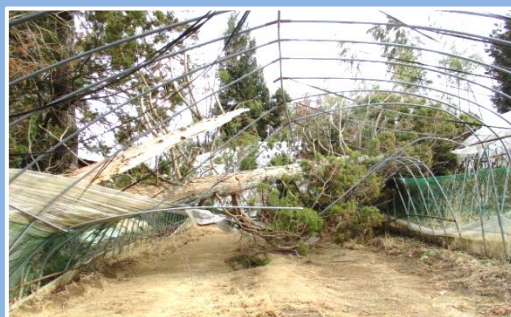
強風により木が倒れ 被害を受けたハウス