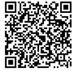
画像送信フォーム